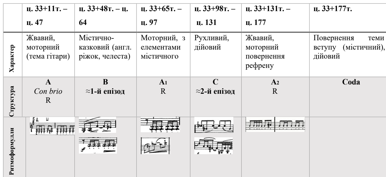
Таблиця 3. Структура III частини Концерту для гітари та камерного ансамблю Р. Родні Беннетта:

Рефрен (А за схемою, Con brio , ц. 33+11т. – ц. 47) представлено жвавою темою в партії гітари. Її головною характеристикою є ритмічний малюнок – чергування восьмих з шістнадцятими в розмірі 5/8, який, як зазначалося раніше, виступає з'єднувальною основою всієї частини. Експонування теми-рефрену у соліста триває шість тактів, після чого її почергово підхоплюють усі інструменти. Епізод побудовано на принципі протиставлення учасників ансамблю та сольного тембру. Наприклад, гітара – дерев'яні духові, струнні, ударні, челеста (тт. 7–11); гітара – бас-кларнет, валторна, ударні, струнні (тт. 12–16); гітара та труба (тт. 23–28). Тембровий контраст підкреслюються акцентами (графічно позначені в нотах), динамікою ( subito p , subito f , mp , ff ); поєднанням синкопованих ритмів зі штрихом staccato . Все вищезазначене втілює моторний рух епізоду. Також, композитором використовуються джазові елементи, у вигляді синкопованих ритмів, квартакордів.